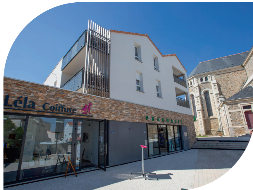
Plein Centre , à Saint-Michel-Chef-Chef, 14 logements & locaux commerciaux