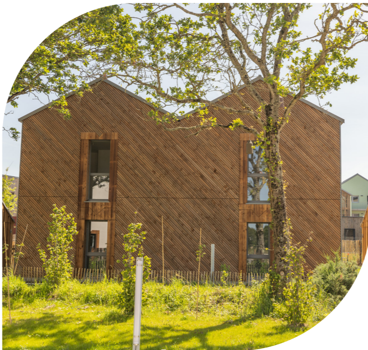
Kenkiz , à Guérande 29 logements collectifs et 2 logements individuels