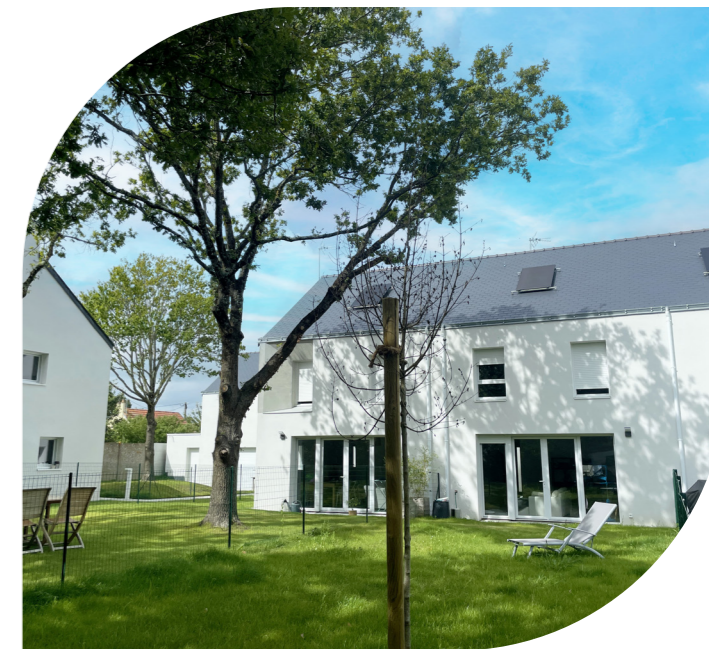
Natura , à Saint-André-des-Eaux, 17 maisons PSLA & 18 appartements locatifs sociaux

Dispositif d'accèsion sociale à la propriété permettant de baisser le coût et de garantir la vocation sociale des logements dans les zones tendues.